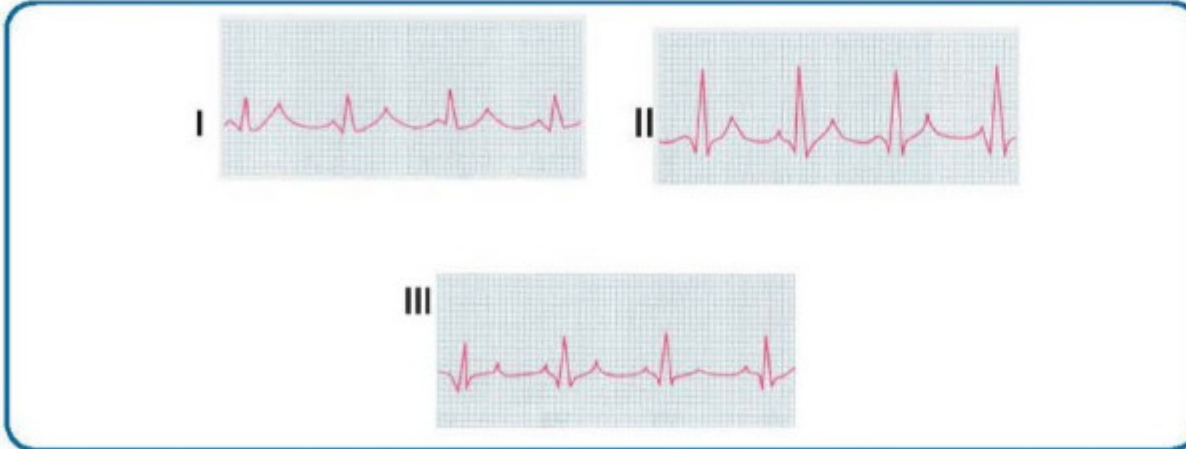
Standart ekstremitte derivasyonları