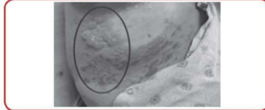
Büllöz pemfigoid lezyon